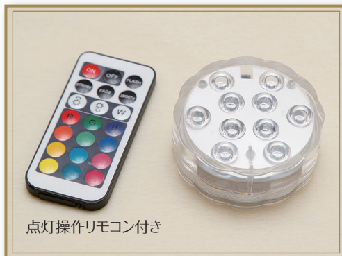
点灯操作リモコン付き