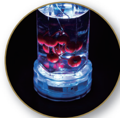
ライトアップコースターとして