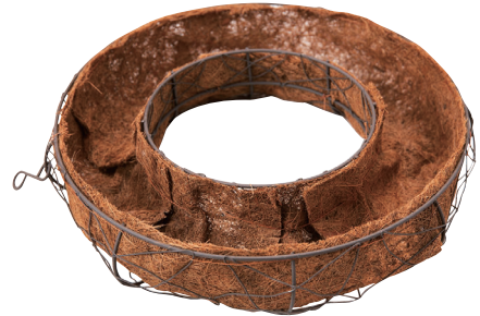
QJ40B☆ ¥3,200(税別) φ40×8.5H 発注単位:1 入数:16入 JAN:-104002