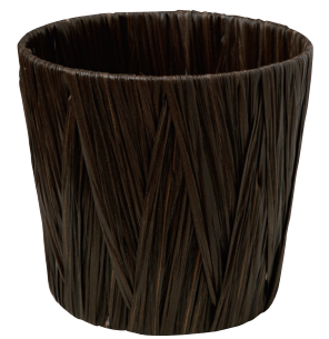
AO60B ¥1,300(税別) 内寸:φ21×18H 発注単位:5 入数:60入 JAN:-601020