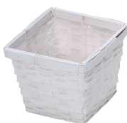
DW35S ¥390(税別) 外寸:13.5×13.5×11H 発注単位:10 入数:300入 JAN: - 343548