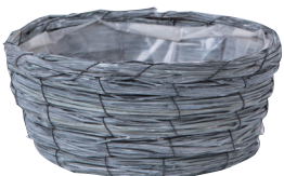
GP65 ¥850(税別) 外寸：φ22×9.5H 発注単位：5 入数：80入 JAN：－746509