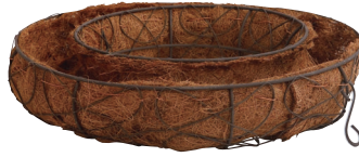
QJ33B☆ ¥2,150(税別) φ34×8H 発注単位:1 入数:16入 JAN:-101339