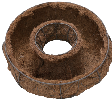
QJ03☆ ¥2,480(税別) φ30×10H 発注単位:1 入数:20入 JAN:-100035