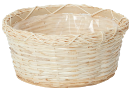
LU65 ¥800(税別) 外寸:φ23×9H 発注単位:10 入数:90入 JAN:-146507 2/3本・3号×3