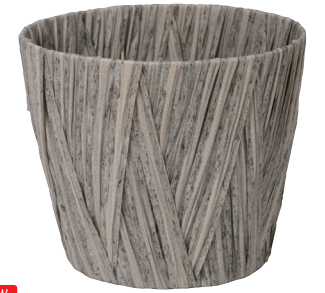
NEW AO60G 内寸:φ21×18H 発注単位:5 入数:60入 JAN:-601075 ¥1,300(税別)