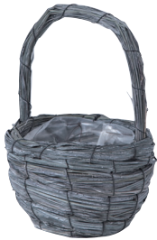
GP116 ¥850(税別) 外寸：φ13×9.5(21H) 発注単位：10 入数：120入 JAN：－741160