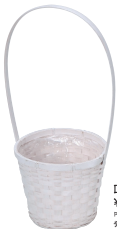
DW150 ¥750(税別) 内寸:φ17×16H(45H) 発注単位:5 入数:60入 JAN: - 341506