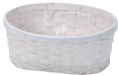
DW302 ¥430(税別) 外寸:φ21×11×9H 発注単位:10 入数:200入 JAN: - 343029