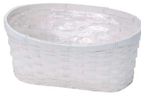
DW402 ¥780(税別) 外寸:φ29×15×13H 発注単位:10 入数:60入 JAN: - 344026