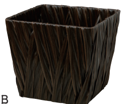
AO40SB ¥780(税別) 外寸:16×16×13H 発注単位:10 入数:120入 JAN:-401125