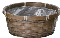
DA63 ¥320(税別) 外寸:φ16×7H 発注単位:16 入数:320入 JAN: - 020630 1/3本