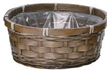
DA64 ¥390(税別) 外寸:φ19×8H 発注単位:10 入数:160入 JAN: - 020647 1/2本