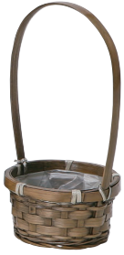
DA161 ¥290(税別) 外寸:φ10×5H(20H) 発注単位:30 入数:360入 JAN: - 021613 1/6本