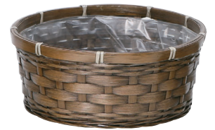
DA66 ¥590(税別) 外寸:φ25×11H 発注単位:10 入数:120入 JAN: - 020661 3/4本・3号×4