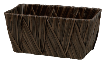
AO352B ¥880(税別) 内寸:22×11×10H 発注単位:10 入数:80入 JAN:-352120