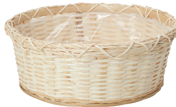
LU67 ¥1,300(税別) 外寸:φ33×11H 発注単位:8 入数:48入 JAN:-147603 1本・3.5号×5.4号×4