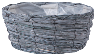
GP66 ¥1,100(税別) 外寸：φ26×11H 発注単位：5 入数：60入 JAN：－746608