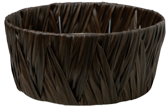
AO67B ¥1,450(税別) 外寸:φ28×13H 発注単位:5 入数:60入 JAN:-671122 1本・3.5号×4