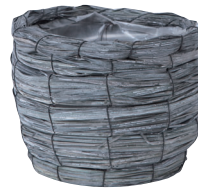
GP56 ¥1,100(税別) 外寸：φ16(外胴寸φ18)×13H 発注単位：6 入数：60入 JAN：－745601