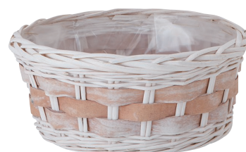
BW67 ¥1,380(税別) 外寸: φ30×13H 発注単位:1 入数:40入 JAN: - 250679 1本・3.5号×4