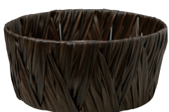
AO64B ¥700(税別) 外寸:φ19×9H 発注単位:10 入数:120入 JAN:-641125 1/2本