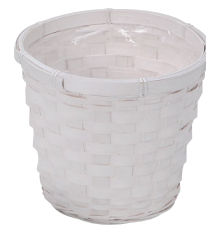
DW60 ¥700(税別) 内寸:φ21×18H 発注単位:10 入数:80入 JAN: - 346006