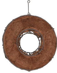
QJ22B☆ ¥1,280(税別) φ22×7H 発注単位:1 入数:60入 JAN:-103227