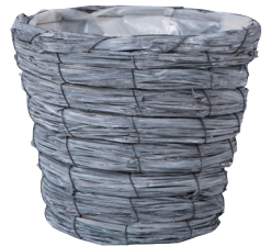
GP50 ¥980(税別) 内寸：φ18×16H 発注単位：10 入数：60入 JAN：－745007