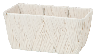
AO352W ¥880 (税別) 内寸:22×11×10H 発注単位:10 入数:80入 JAN: - 352113