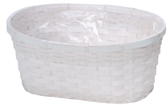
DW502 ¥980(税別) 外寸:φ34×19×15H 発注単位:10 入数:60入 JAN: - 345023