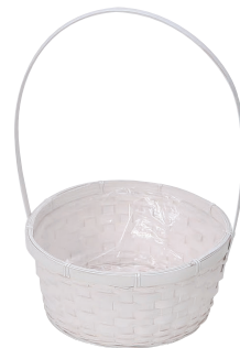
DW165 ¥780(税別) 外寸:φ23×10.5H(35H) 発注単位:10 入数:60入 JAN: - 341650 2/3本・3号×3