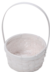
DW162 ¥360(税別) 外寸:φ13×6H(24H) 発注単位:20 入数:120入 JAN: - 341629 1/4本