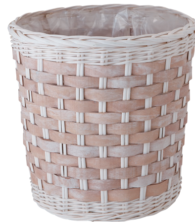
BW10 ¥3,850(税別) 内寸: φ34×36H 発注単位:1 入数:8入 JAN: - 250105