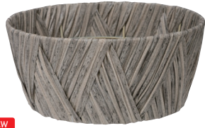
NEW AO65G 外寸:φ21×10H 発注単位:5 入数:90入 JAN:-651179 2/3本・3号×3 ¥950(税別)