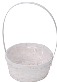
DW164 ¥620(税別) 外寸:φ20×9H(32H) 発注単位:10 入数:80入 JAN: - 341643 1/2本