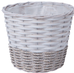
JW60 ¥1,100(税別) 内寸:φ21×18H 発注単位:5 入数:48入 JAN:-526002