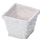
DW30S ¥340(税別) 外寸:11.5×11.5×9.5H 発注単位:20 入数:480入 JAN: - 343043