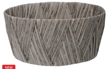
NEW AO67G 外寸:φ28×13H 発注単位:5 入数:60入 JAN:-671177 1本・3.5号×4 ¥1,450(税別)