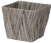
NEW AO35SG 外寸:13×13×11H 発注単位:10 入数:120入 JAN:-351178 ¥580(税別)