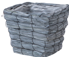
GP40S ¥800(税別) 外寸：15.5×15.5×13.5H 発注単位：10 入数：90入 JAN：－744017