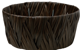
AO65B ¥950(税別) 外寸:φ21×10H 発注単位:5 入数:90入 JAN:-651124 2/3本・3号×3