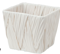
AO35SW ¥580 (税別) 外寸:13×13×11H 発注単位:10 入数:120入 JAN: - 351116