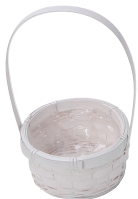
DW161 ¥290(税別) 外寸:φ11×6H(19.5H) 発注単位:30 入数:270入 JAN: - 341612 1/6本