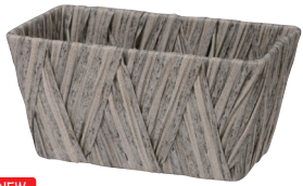
NEW AO302G 内寸:19×10×9H 発注単位:10 入数:120入 JAN:-302170 ¥650(税別)