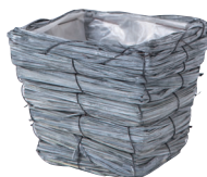
GP35S ¥650(税別) 外寸：13×13×11H 発注単位：10 入数：120入 JAN：－743515