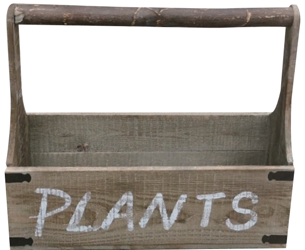
LW79 ¥3,800(税別) 全体:45×15×40H 内寸:43×14×15H 発注単位:1 入数:10入 JAN:-060797

※JANコード番号は、下6桁を掲載しております。頭に4943863の7桁を付けて下さい。