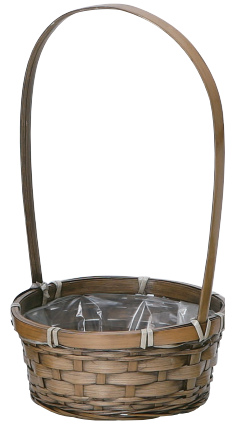
DA164 ¥530(税別) 外寸:φ19×8H(33H) 発注単位:10 入数:80入 JAN: - 021644 1/2本