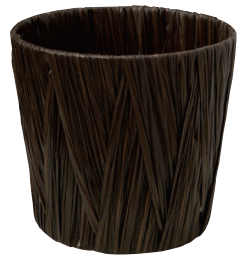
AO50B ¥900(税別) 内寸:φ17×15.5H 発注単位:10 入数:90入 JAN:-501023