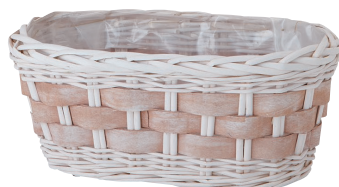
BW402 ¥1,150(税別) 内寸: 28×15×13H 発注単位:6 入数:48入 JAN: - 254028