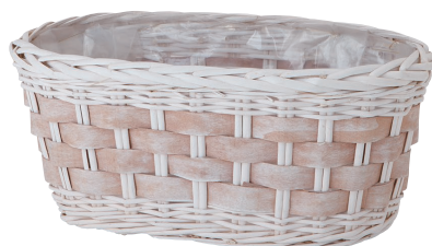
BW502 ¥1,600(税別) 内寸: 36×18×16H 発注単位:6 入数:24入 JAN: - 255025