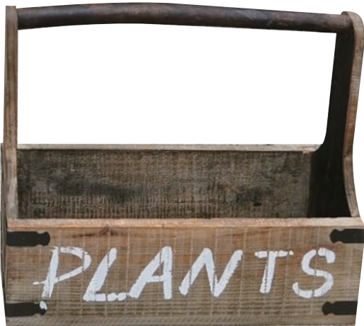
LW78 ¥2,800(税別) 全体:35×11×33H 内寸:33×10×11H 発注単位:1 入数:18入 JAN:-060780