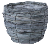
GP55 ¥780(税別) 外寸：φ13.5(外胴寸φ14.5)×11H 発注単位：10 入数：120入 JAN：－745502