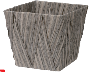
NEW AO50SG 外寸:18×18×16H 発注単位:10 入数:90入 JAN:-501177 ¥1,000(税別)