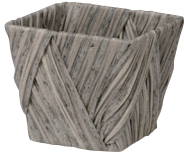
NEW AO30SG 外寸:11×11×9.5H 発注単位:10 入数:160入 JAN:-301173 ¥480(税別)