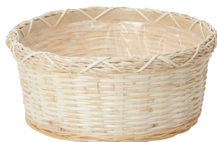
LU66 ¥1,000(税別) 外寸:φ28×10H 発注単位:10 入数:60入 JAN:-146606 3/4本・3号×4