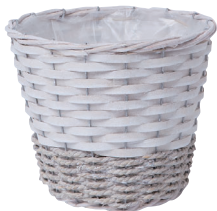
JW50 ¥950(税別) 内寸:φ18×15H 発注単位:10 入数:72入 JAN:-525005