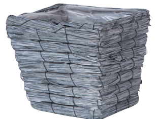
GP50S ¥1,100(税別) 外寸：19×19×16.5H 発注単位：10 入数：60入 JAN：－745014

※JANコード番号は、下6桁を掲載しております。頭に4943863の7桁を付けて下さい。