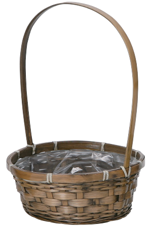
DA165 ¥700(税別) 外寸:φ22×9H(36H) 発注単位:10 入数:60入 JAN: - 021651 2/3本・3号×3