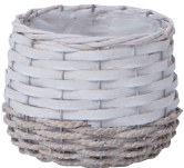
JW23 ¥750(税別) 外寸:φ13.5×11H 発注単位:10 入数:80入 JAN:-522301