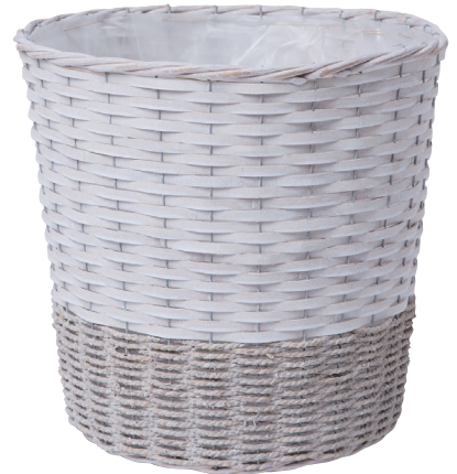
JW10 ¥4,500(税別) 内寸:φ36×35H 発注単位:1 入数:8入 JAN:-521007