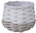
JW22 ¥650(税別) 外寸:φ12×9.5H 発注単位:10 入数:100入 JAN:-522202