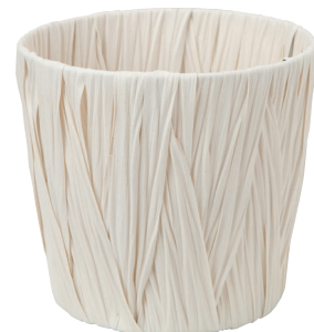
AO60W ¥1,300 (税別) 内寸: φ21×18H 発注単位:5 入数:60入 JAN: - 601013

※JANコード番号は、下6桁を掲載しております。頭に4943863の7桁を付けて下さい。