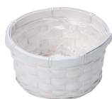
DW62 ¥270(税別) 外寸:φ13×6H 発注単位:30 入数:360入 JAN: - 340622 1/4本