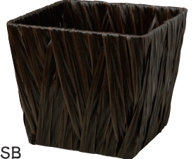
AO50SB ¥1,000(税別) 外寸:18×18×16H 発注単位:10 入数:90入 JAN:-501122