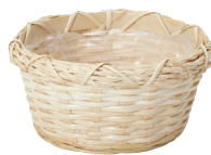
LU63 ¥500(税別) 外寸:φ17×7H 発注単位:20 入数:180入 JAN:-140635 1/3本