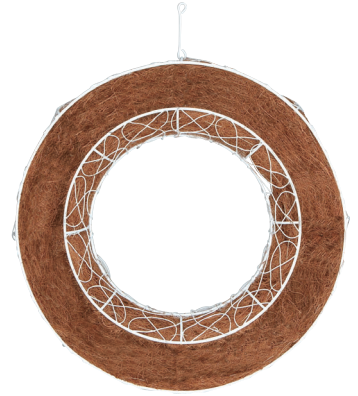
QJ33W☆ ¥2,150(税別) φ34×8H 発注単位:1 入数:16入 JAN:-100332