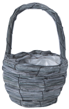
GP115 ¥750(税別) 外寸：φ11×8(17.5H) 発注単位：10 入数：120入 JAN：－741153