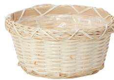
LU64 ¥600(税別) 外寸:φ21×8H 発注単位:10 入数:120入 JAN:-146408 1/2本