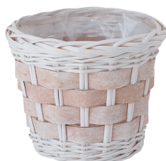
BW50 ¥850(税別) 内寸: φ18×16H 発注単位:8 入数:72入 JAN: - 250501