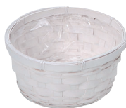
DW63 ¥370(税別) 外寸:φ16×7H 発注単位:16 入数:320入 JAN: - 346303 1/3本