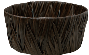
AO66B ¥1,150(税別) 外寸:φ24×11H 発注単位:5 入数:60入 JAN:-661123 3/4本・3号×4