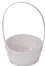
DW163 ¥460(税別) 外寸:φ16×7H(28H) 発注単位:20 入数:120入 JAN: - 341636 1/3本