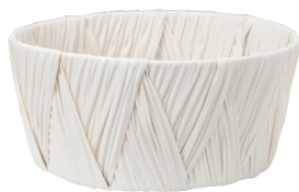
AO65W ¥950 (税別) 外寸: φ21×10H 発注単位:5 入数:90入 JAN: - 651117 2/3本・3号×3