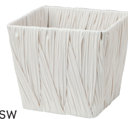
AO50SW ¥1,000 (税別) 外寸:18×18×16H 発注単位:10 入数:90入 JAN: - 501115