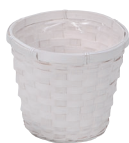
DW30 ¥260(税別) 内寸:φ10.5×9H 発注単位:20 入数:240入 JAN: - 343005