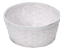
DW66 ¥690(税別) 外寸:φ25×11H 発注単位:10 入数:120入 JAN: - 346600 3/4本・3号X4