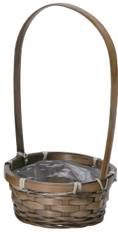
DA162 ¥350(税別) 外寸:φ13×6H(24H) 発注単位:20 入数:240入 JAN: - 021620 1/4本