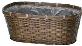
DA402 ¥780(税別) 内寸:29×15×13H 発注単位:10 入数:90入 JAN: - 024027