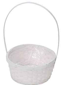
DW166 ¥900(税別) 外寸:φ25×11H(40H) 発注単位:8 入数:48入 JAN: - 341667 3号×4