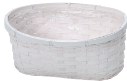
DW352 ¥530(税別) 外寸:φ26×13×11H 発注単位:10 入数:160入 JAN: - 343524