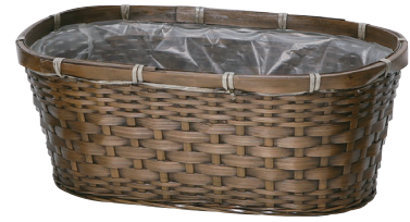
DA502 ¥980(税別) 内寸:36×18×16H 発注単位:10 入数:60入 JAN: - 025024