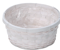
DW64 ¥450(税別) 外寸:φ19×8H 発注単位:10 入数:160入 JAN: - 346402 1/2本