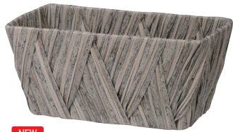
NEW AO352G 内寸:22×11×10H 発注単位:10 入数:80入 JAN:-352175 ¥880(税別)