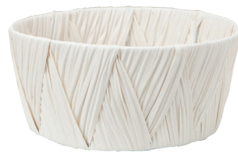
AO67W ¥1,450 (税別) 外寸: φ28×13H 発注単位:5 入数:60入 JAN: - 671115 1本・3.5号×4