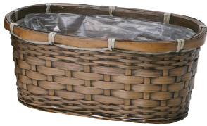
DA352 ¥600(税別) 内寸:26×13×11H 発注単位:10 入数:160入 JAN: - 023525