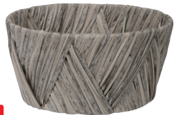
NEW AO64G 外寸:φ19×9H 発注単位:10 入数:120入 JAN:-641170 1/2本 ¥700(税別)