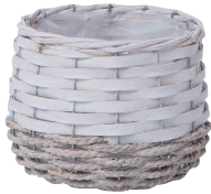
JW29 ¥1,250(税別) 外寸:φ17×17H 発注単位:1 入数:36入 JAN:-522905