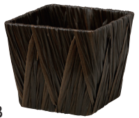
AO35SB ¥580(税別) 外寸:13×13×11H 発注単位:10 入数:120入 JAN:-351123