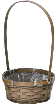
DA163 ¥430(税別) 外寸:φ16×7H(28H) 発注単位:20 入数:120入 JAN: - 021637 1/3本