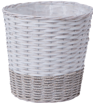
JW8 ¥3,200(税別) 内寸:φ29×28H 発注単位:1 入数:12入 JAN:-528006