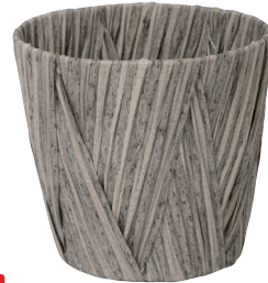
NEW AO50G 内寸:φ17×15.5H 発注単位:10 入数:90入 JAN:-501078 ¥900(税別)