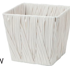
AO40SW ¥780 (税別) 外寸:16×16×13H 発注単位:10 入数:120入 JAN: - 401118