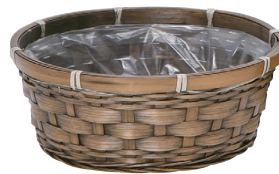
DA65 ¥490(税別) 外寸:φ22×9H 発注単位:10 入数:150入 JAN: - 020654 2/3本・3号×3