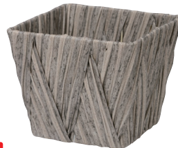
NEW AO40SG 外寸:16×16×13H 発注単位:10 入数:120入 JAN:-401170 ¥780(税別)