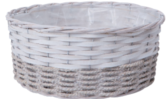
JW67 ¥1,480(税別) 外寸:φ29×12H 発注単位:1 入数:40入 JAN:-526705