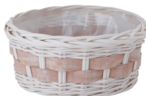
BW66 ¥1,000(税別) 外寸: φ25×12H 発注単位:5 入数:60入 JAN: - 250662 3/4本・3号×4、・3.5号×3