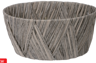
NEW AO66G 外寸:φ24×11H 発注単位:5 入数:60入 JAN:-661178 3/4本・3号×4 ¥1,150(税別)