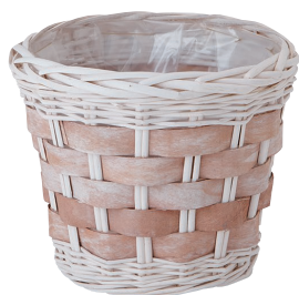
BW60 ¥1,200(税別) 内寸: φ21×18H 発注単位:6 入数:48入 JAN: - 250600