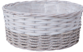
JW66 ¥1,100(税別) 外寸:φ25×11H 発注単位:1 入数:60入 JAN:-526606